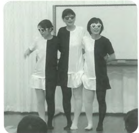
パフォーマンス発表 (精神看護学概論)