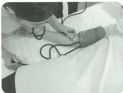
学内演習 (血圧測定)