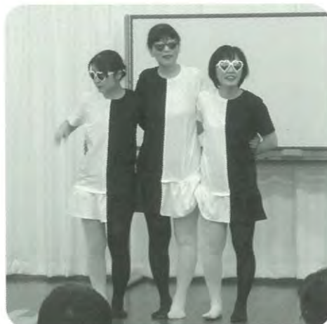
パフォーマンス発表 (精神看護学概論)